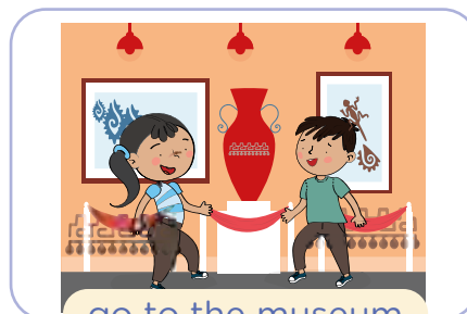
go to the museum