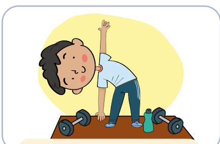
go to the gym