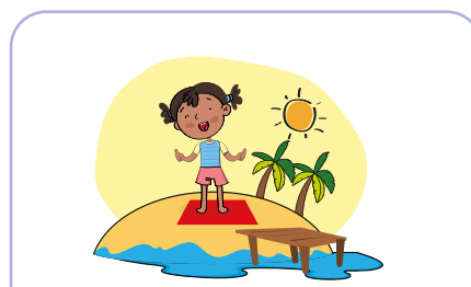
go to the beach