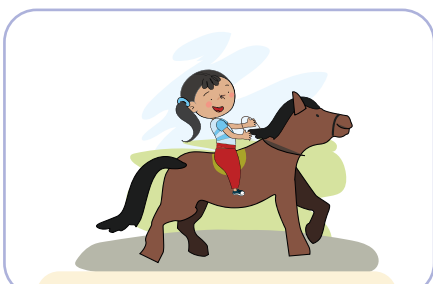
ride a horse