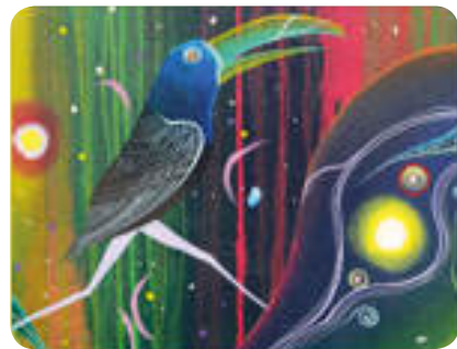
Fuente: Ilustración del libro “Antiguamente en el monte los animales, las plantas y otros seres eran gente” de Rember Yahuarcani

“ Nuestro Saber ” es un video producido por el Ministerio de Cultura (Videoteca de las Culturas) en el año 2013, en el que se narra cómo es la preparación de la chicha de jora por parte de las mujeres de la comunidad de Chanen, Vilcashuamán, Ayacucho.