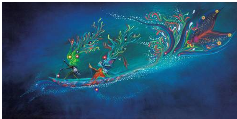
Figura 1: Jiaño

Fuente: López, M.; López, N.; Yahuarcani, S. & Yahuarcani, R. (2017). Jiaño Nokikuriño. El Verano y La Lluvia. Mito de la nación uitoto-áimeni , (pp. 20-21). Lima, Perú: Casa de la Literatura.