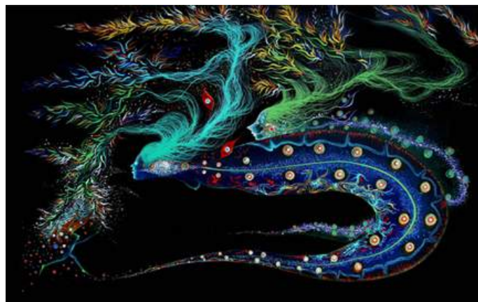
Figura 2: Nokikuriño